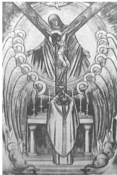
Het ware Lichaam van Christus

"Laat u als levende stenen gebruiken voor de bouw van een geestelijk huis..." (1 Petrus 2, 5)