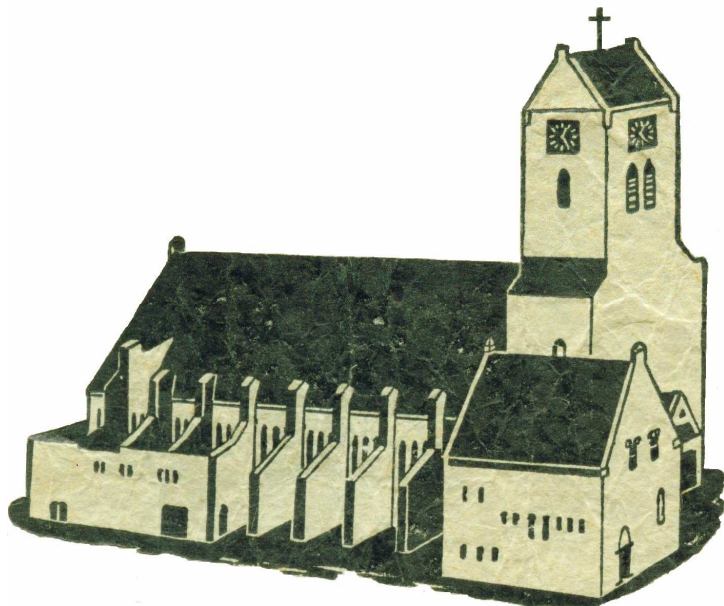
ONZE LIEVE VROUW VAN GOEDE RAADKERK BEVERWIJK